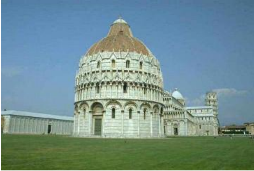
دیمه‌نیکی کاتیدرالی پیزا و بورجه لاره‌که‌ی، پیزا، ئیتالیا Pisa Cathedral

هونهری ئه‌وروی سده‌کانی ناوه‌راست و پینسانس ۲۵۱